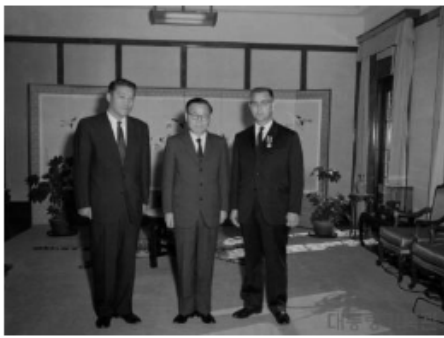
윤보선 대통령 스완스박사서훈후기념 촬영(1961)

대통령 기록관 링크 https://www.pa.go.kr/online_contents/archive/president_mediaIndex.jsp?activePresident=%EC%9C%A4%EB%B3%B4%EC%84%A0