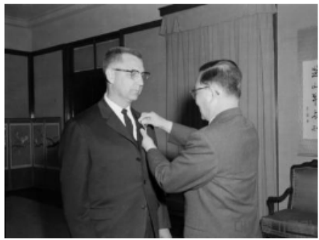
윤보선 대통령 스완스박사서훈(1961)